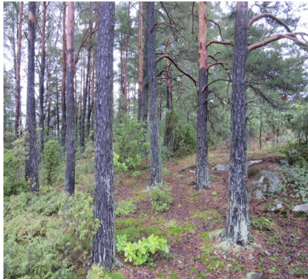
Kartprov ROC 2 stadsnära vildmarksterräng