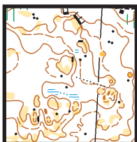
Kartprov: Område med finorientering för Långa E2, Korta E2 och Ö7

Medeldistansbana med riktningssändringar. Här är det en blandning av storskog, lite grönområden och lite hyggesorientering. Gallring har skett i området men det mesta av riset har samlats ihop.