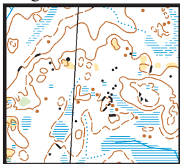
Kartprov: Norra delen av Långa E1 + Ö9

Cirka 4 km av banan är helt nyritad och detta område har inte använts på länge för orientering.