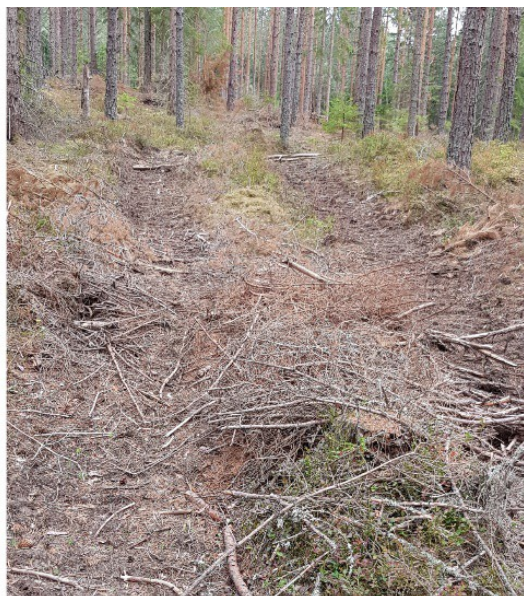
Exempel på otydlig, ej redovisad på kartan