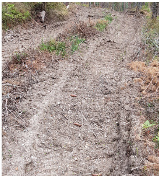
Exempel på tydlig, redovisad på kartan

På de ställen där de yngsta ungdomsbanorna går är stigarna förstärkta med vit snitsel.