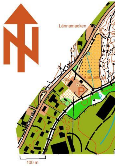
Karta 1. Parkering vid TC