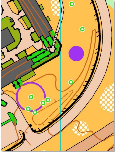
Kartprov, med Samlingsplatsen och Sista kontrollen