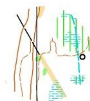
Så här ser den ut på kartan

De flesta banor kommer i kontakt med en gammal ledningsgata som är markerad på kartan som rågång eller smal, gul linje