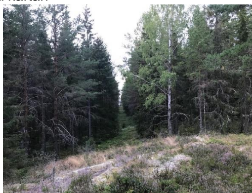
Så här ser den ut i skogen

Otydliga stigar som berör ungdomsbanor är förstärkta med vit snitsel. En ny ledstång markerad med violett på kartan och heldragen rödvit snitsel i skogen berör främst HD10 och Mycket lätt 2 km. Se bildexempel.