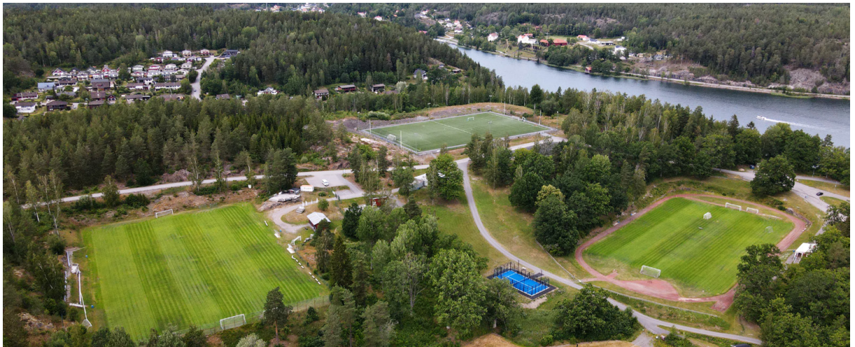
Sveriges vackraste arena i Grännäs med OL-arenan till höger. Vindskydd och boendetält på de andra två planerna.

Vi bjuder i övrigt på en mycket avancerad arenaproduktion som garanterar förstklassig underhållning och med Per Forsberg som kommentator. Tiomila 2021 kommer även att sända arenaproduktionen via webb-TV-sändning. Bok-