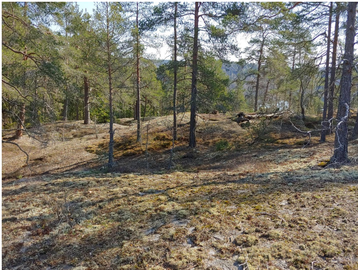
Hållmarker på Hågelbydubbeln.

När Hågelbydubbeln hålls den 30 april till 1 maj kommer Hågelby att användas som arena. Gert Pettersson är även banläggare till tävlingen på valborgsmässoafton. 1 maj är det Fredrik Forsberg som varit med och digitaliserat kartan den som lägger banorna.