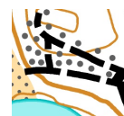
"ÖPPEN MARK MED SPRIDDA TRÄD" TILLÅTET ATT T SNEDDA ÖVER