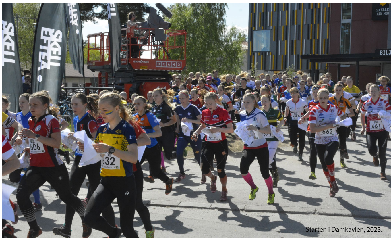
Starten i Damkavlen, 2023.

Vi vill behålla bilden av de många pannlamporna som ger sig ut i kvällsmörkret, vilket innebär att damerna