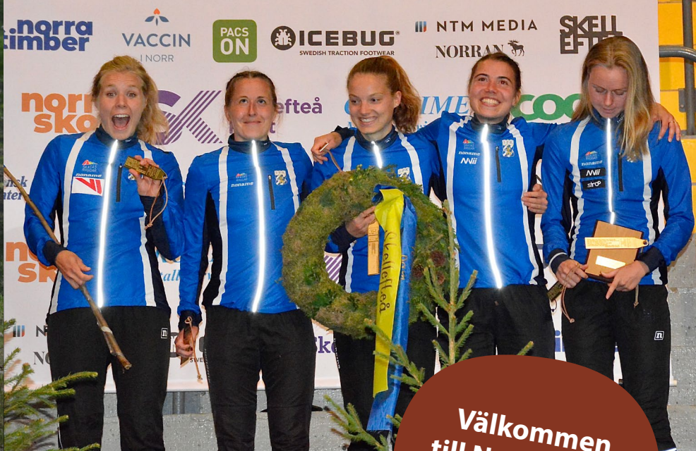
IFK Göteborg vinnare i Dam- kavlen, 2023. ▶

Välkommen till Nynäshamn och Tiomila 4-5 maj 2024