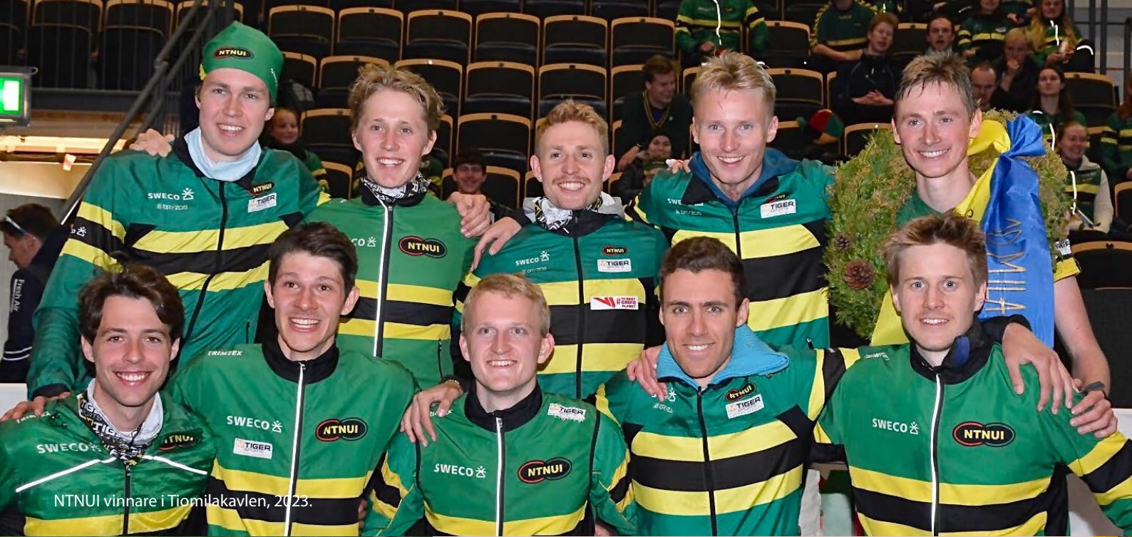
NTNUI vinnare i Tiomilakavlen, 2023.