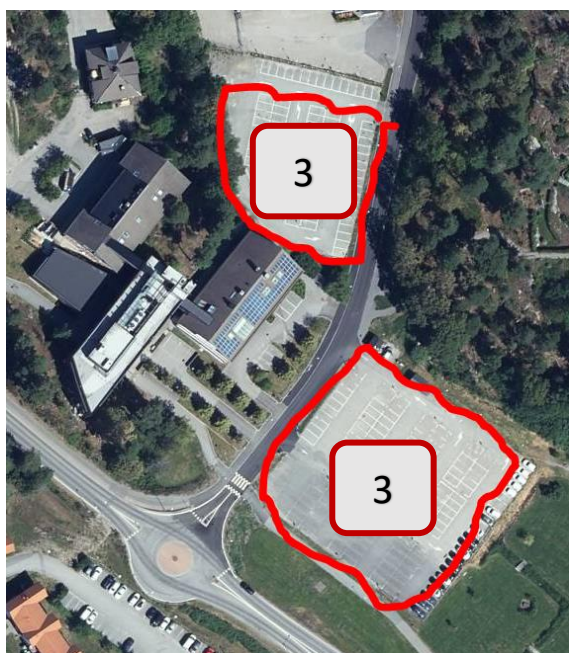
Parkering 3 – Skogsbo