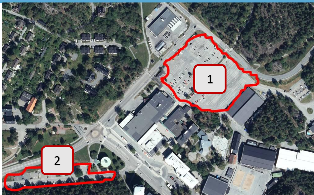
Parkering 1 – Gustavsbergs Centrum och Parkering 2 – Bagarvägen