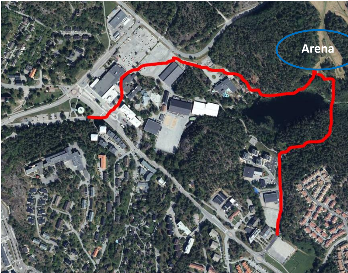
Väg från parkering till arena, snitslad enligt bild ovan. Avstånd ca 400-700 meter.