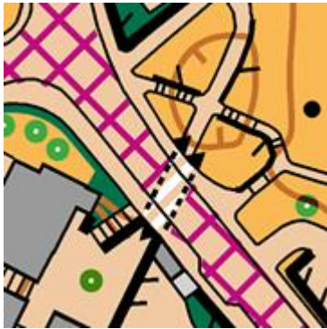
Bild 1. Passage under väg via tunnel